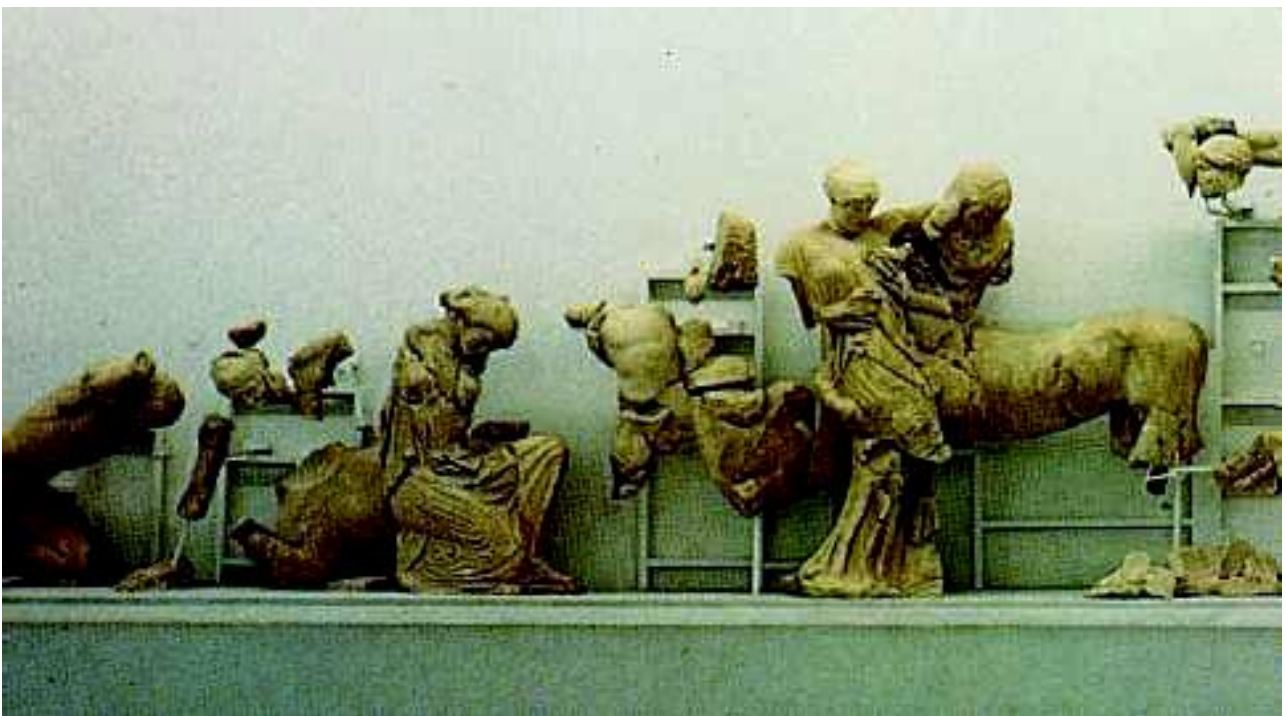
4. Κενταυρομαχία, από το ναό του Διός

το αέτωμα: το τριγωνικό μέρος στο οποίο καταλήγει η στέγη ενός αρχαίου ναού (κάθε ναός έχει δύο αετώματα).