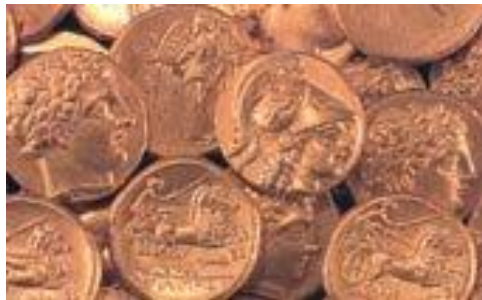
Χρυσοί στατήρες του Φιλίππου και του Αλεξάνδρου. (Αθήνα, Νομισματικό Μουσείο.)

Την παράδοση των προκατόχων του να προσκαλούν στην αυλή τους ποιητές, στοχαστές και καλλιτέχνες τη συνέχισε και ο Φίλιππος, ο οποίος έδειχνε ιδιαίτερη αδυναμία στο θέατρο.