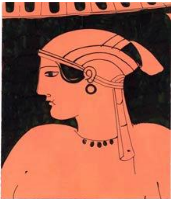
Εταίρα. [Αντιγραφή: Στ. Μπονάτσος]

2. Στους στ. 7 κε. ο ποιητής χρησιμοποιεί παρατακτική σύνταξη (δύο κύριες προτάσεις, εκεί που λογικά θα μπορούσε να χρησιμοποιήσει μία υποθετική και μία κύρια. Π.χ. στ. 7: Αν είναι κάποια κοντή, τοποθετείται κτλ.). Για ποιο λόγο νομίζετε ότι επέλεξε ο ποιητής την παρατακτική σύνταξη;