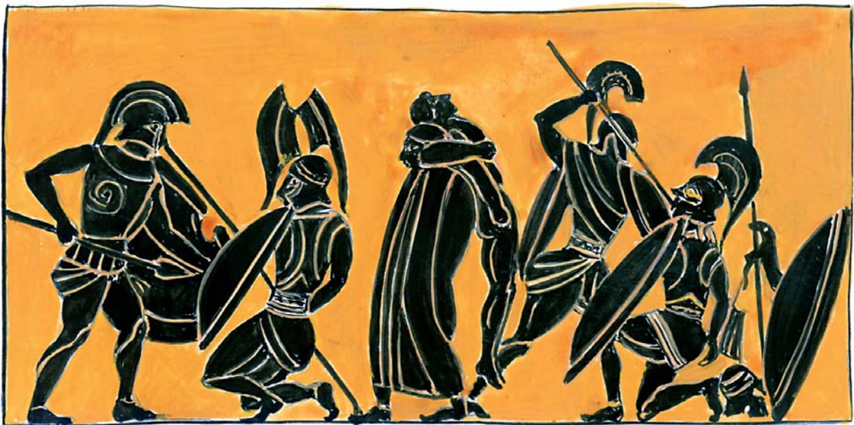
Εικόνα 23. Σκηνές μάχης μεταξύ Τρώων και Αχαιών. Αρχαϊκός μελανόμορφος αμφορέας. Ρώμη, Συλλογή Basseggio (αντίγραφο).

ακολουθήσουν: ο γέροντας της Πύλου παρουσιάζει στον Πάτροκλο την κρισιμότητα της κατάστασης και τον παρακινεί να μεταπείσει τον Αχιλλέα να γυρίσει στη μάχη ή, σε αντίθετη περίπτωση, να οδηγήσει ο ίδιος τους Μυρμιδόνες στη μάχη, φορώντας την πανοπλία του Αχιλλέα. Ίσως τότε, λέει, οι Τρώες να τρομάξουν και να υποχωρήσουν. Θα έχει άραγε αποτέλεσμα αυτή η δεύτερη και ανεπίσημη «πρεσβεία» στον Αχιλλέα;