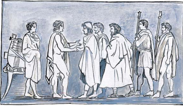
Εικόνα 21. Η πρεσβεία φτάνει στη σκηνή του Αχιλλέα. Χαλκογραφία σε σχέδιο του John Flaxman, 1805 (αντίγραφο).