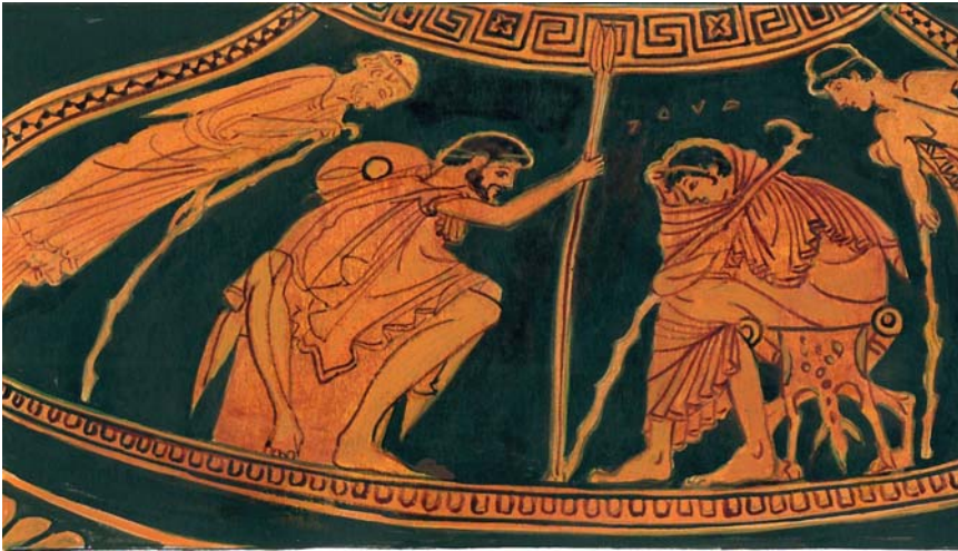
Εικόνα 20. Η πρεσβεία επισκέπτεται τον Αχιλλέα. Ζωγραφική σε υδρία του ζωγράφου Κλεοφράδη, περίπου 480-470 π.Χ. Μόναχο (αντίγραφο).

την μεγαλόκαρδην ψυχὴν· προτίμα να ἴσαι πράος· ἀπεχε απ' την κακόπρακτον την ἐριδα, ὥστε πλέον θα σε τιμήσουν οἱ Αἰχαιοὶ καὶ γέροντες καὶ νέοι».