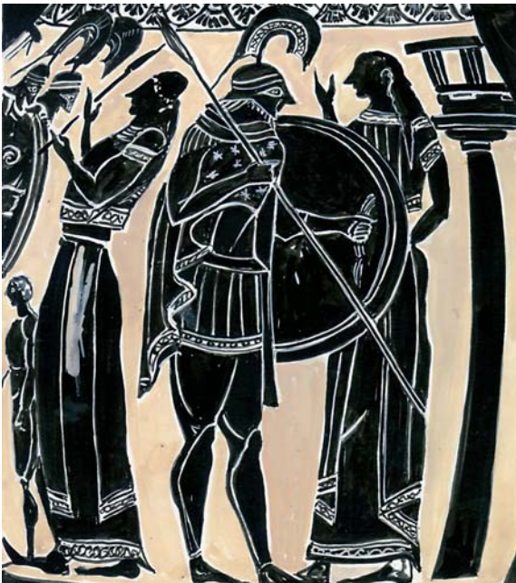
Εικόνα 15. Ο Έκτορας αποχαιρετά την Ανδρομάχη. Χαλκιδικός κρατήρας του 540/530 π.χ. Μουσείο Würzburg, Γερμανία (αντίγραφο)